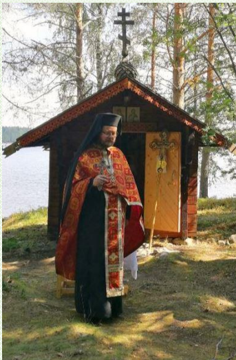
Pyhän Paraskevan tsasouna Koskijärven rannalla

Elämänsä lopulla pyhästä Serafimista tuli rakastettu hengellinen ohjaaja. Hänen tunnetuin ohjeensa on: ”Hanki sisäinen rauha, niin tuhannet ympärilläsi pelastuvat.”